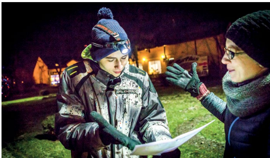
FUNDACJA PRO VITAE

Pierwsi uczestnicy ruszą na trasę o 17:00. Trasa A przeznaczona jest dla wyczynowców, którym zależy na rywalizacji, start in-